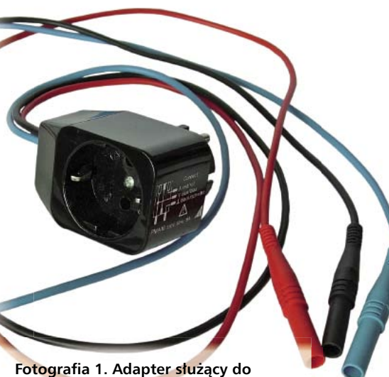
Fotografia 1. Adapter służący do pomiarów mocy