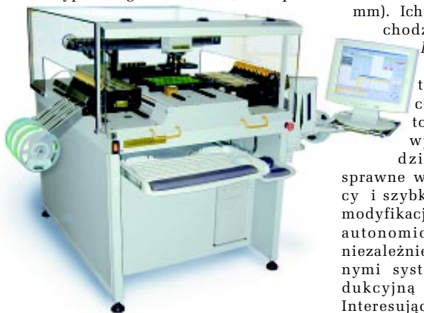
Fot. 1. Automat Pick & Place L60

Najbardziej zaawansowaną technicznie, a chyba i najciekawszą grupę stanowią automaty pick & place , zgrupowane w typoszeręgu „L” (fot. 1). Ich pod-