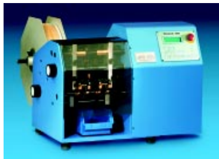
Fot. 6. Automat do krępowania elementów ze sterowaniem automatycznym

Lutowanie w wydaniu APS to proces przebiegający zgodnie z zaprogramowanym profilem termicznym, odbywający