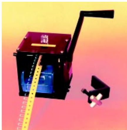
Fot. 5. Automat do krępowania elementów ze sterowaniem ręcznym