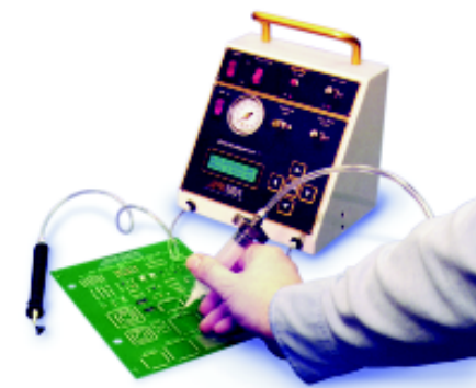
Fot. 3. Programowalny dozownik kleju/pasty GDV-20 z pęsetą próżniową