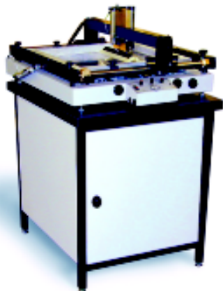
Fot. 4. Drukarka szablonoowa SPR-45

uwagę na automaty APS P20/P40: są one mniejsze, lżejsze, mają trochę mniej „wyśrubowane“ parametry. Na przykład maksymalna wydajność wynosi tu 1500...2500 cph, dokładność pozycjonowania \pm 0,005'' , a minimalny raster - 20 milów. Liczby podajników mogących pracować równocześnie wynoszą 48 i 80, odpowiednio dla P20 i P40 (taśma 8 mm). Podobnie jak w serii „L“, przewidziano tu zasobniki i podajniki do wielu rodzajów elementów. Są też zintegrowane kompresory.