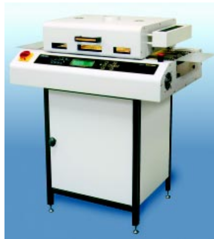
Fot. 7. Piec GF-12A do lutowania rozpliwowego

się we wnętrzu jednego z czterech oferowanych obecnie pieców serii „GF“ (fot. 7). Elementy grzejne pieca (konwekcyjne) są rozmieszczone tak w górnej, jak i dolnej części komory, tworząc strefy nagrzewania. Komora jest wykonana ze stali nierdzewnej. Osiągnięcie równomiernego rozkładu temperatur w płycie PCB zapewnia opatentowany system Cyclonic™ wymuszający ruch powietrza (albo azotu). Odpowiednio rozłożone termopary, współpracują z komputerowym sterownikiem. Na życzenie firma wyposaża urządzenie w promienniki podczerwieni - jest to jednak rozwiązanie wybierane coraz rzadziej. Operator ma wszakże możliwość obserwacji procesu przez duży wziernik znajdujący się na górnej ścianie komory - jej wnętrze jest oświetlone. Tuż za wyjściem z tunelu pieca znajduje się strefa chłodzenia, gdzie przebiega ostatnia faza lutowania. Płyta poddawana powyższym zabiegom przesuwana jest na szerokim (305 mm) transporterze. Oprogramowanie pozwala m.in. na wprowadzenie i zapamiętanie do 100 profili, zaprogramowanie timera (do 7 dni), monitorowanie i raportowanie usterek zgodnie z ISO9000 SPC, ochronę wprowadzonych danych hasłem.