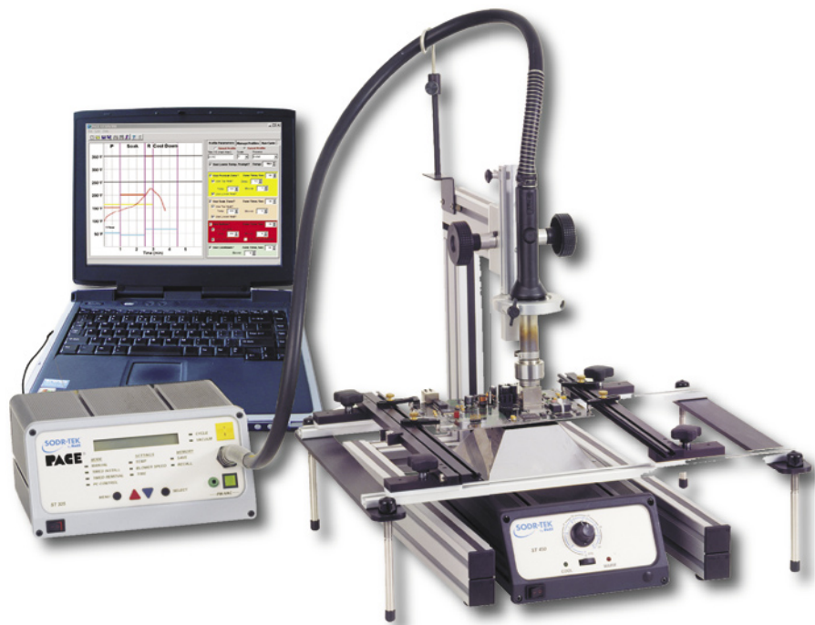
Zestaw montażowo/demontażowy SMT/BGA oparty na PACE ST-325

Opisane stacje lutownicze to jedynie część bogatej oferty narzędzi do montażu i demontażu elementów elektronicznych firmy Pace. W kolejnej części artykułu omówione zostaną jeszcze bardziej zaawansowane urządzenia – zanim to jednak nastąpi, warto zwrócić uwagę na jeszcze jeden produkt tej firmy, dedykowany do pracy z układami BGA. Trudności montażu, jak też demontażu tego typu układów są bowiem nieporównywalnie większe niż w przypadku innych elementów SMT. Przed przylutowaniem BGA, konieczne jest wypozycjonowanie układu, a następnie wykonanie skomplikowanego procesu lutowania, do którego używa się zwykle strumienia gorącego powietrza. Wskazane jest przy tym zastosowa-