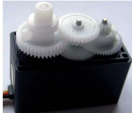
Fot. 4. Przekładnia serwo-mechanizmu przed wykonaniem modyfikacji

Sygnal sterujący decyduje o wychyleniu osi serwo-mechanizmu. Jest to zwykle sygnał z modulacją długości impulsów (nazywany tutaj Pulse Position Modulation ), który porównywany jest w układzie scalonego sterownika silnika z bieżącym położeniem (odzworowanym przez wspomniany wcześniej potencjometr), powodując odpowiednie jej wychylenie proporcjonalne do wypełnienia impulsów sterujących. Zakres dopuszczalnych wychyleń możliwych do osiągnięcia przez oś serwo-mechanizmu zależy od jego konstrukcji mechanicznej oraz od konfiguracji samego sterownika, lecz zwykle nie przekracza 120°. Z tej właściwości wynika fakt nieprzydatności takiego mechanizmu dla naszego projektu bez poddania go pewnym, drobnym modyfikacjom, zarówno w części mechanicznej, jak i elektrycznej. Modyfikacja mechaniczna polega na usunięciu blokady ogranicznika kąta wychylenia osi serwo-mechanizmu, a sprowadza się do usunięcia (za pomocą ostrego nożyka) małego występu na jednej z zębatek przekładni oraz wyjęcia niepotrzebnego już potencjometru. Modyfikacja elektryczna polega na usunięciu niewykorzystywanego w naszym układzie sterownika i przyłutowaniu przewodów połączeniowych serwo-mechanizmu do zacisków silnika prądu stałego. Proces modyfikacji przykładowego serwo-mechanizmu modelarskiego przedstawiono na fotografiach 1...5. W ten prosty sposób otrzymujemy idealny element napędowy dysponujący całkiem sporym momentem napędowym.