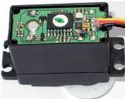
Fot. 2. Wygląd płytki sterownika serwo-mechanizmu po zdjęciu pokrywy górnej

mentów, jakie mogą być jego częścią składową, stale rośnie. Czyż można w takim razie elementem takiego systemu uczynić zwykle rolety wewnętrzne? Oczywiście, czego mam nadzieję dowiedzie niniejszy artykuł.