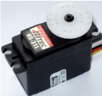
Fot. 1. Wygląd typowego serwomechanizmu przed wykonaniem modyfikacji