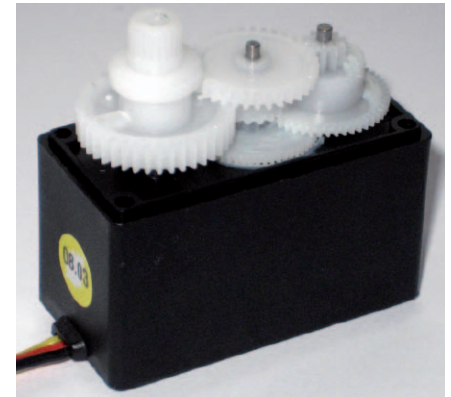
Fot. 5. Przekładnia serwo-mechanizmu po usunięciu występu blokady maksymalnego wychylenia osi

Sygnal sterujący decyduje o wychyleniu osi serwo-mechanizmu. Jest to zwykle sygnał z modulacją długości impulsów (nazywany tutaj Pulse Position Modulation ), który porównywany jest w układzie scalonego sterownika silnika z bieżącym położeniem (odzworowanym przez wspomniany wcześniej potencjometr), powodując odpowiednie jej wychylenie proporcjonalne do wypełnienia impulsów sterujących. Zakres dopuszczalnych wychyleń możliwych do osiągnięcia przez oś serwo-mechanizmu zależy od jego konstrukcji mechanicznej oraz od konfiguracji samego sterownika, lecz zwykle nie przekracza 120°. Z tej właściwości wynika fakt nieprzydatności takiego mechanizmu dla naszego projektu bez poddania go pewnym, drobnym modyfikacjom, zarówno w części mechanicznej, jak i elektrycznej. Modyfikacja mechaniczna polega na usunięciu blokady ogranicznika kąta wychylenia osi serwo-mechanizmu, a sprowadza się do usunięcia (za pomocą ostrego nożyka) małego występu na jednej z zębatek przekładni oraz wyjęcia niepotrzebnego już potencjometru. Modyfikacja elektryczna polega na usunięciu niewykorzystywanego w naszym układzie sterownika i przyłutowaniu przewodów połączeniowych serwo-mechanizmu do zacisków silnika prądu stałego. Proces modyfikacji przykładowego serwo-mechanizmu modelarskiego przedstawiono na fotografiach 1...5. W ten prosty sposób otrzymujemy idealny element napędowy dysponujący całkiem sporym momentem napędowym.