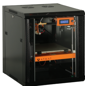
ATMAT SIGNAL XL zamontowana w szafie RACK 19" 12U Maksymalny wymiar wydruku: 310 × 320 × 260 mm

Do rodziny drukarek ATMAT SIGNAL należą następujące modele: