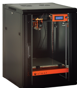
ATMAT SIGNAL XXL zamontowana w szafie RACK 19" 15U Maksymalny wymiar wydruku: 310 × 320 × 385 mm