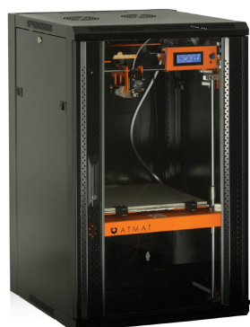
ATMAT SIGNAL XXXL zamontowana w szafie RACK 19" 18U Maksymalny wymiar wydruku: 310 × 320 × 510 mm